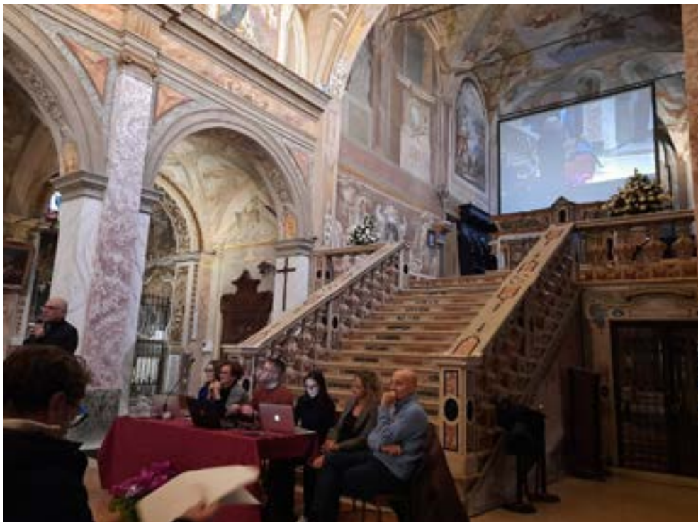
Nella foto i progettisti alla presentazione dei lavori nella chiesa di San Giacomo Per ragioni di spazio siamo costretti a rimandare alla prossima settimana la pubblicazione della notizia completa

Sarà necessario un ulteriore progetto di ampio respiro per risolvere tutti i problemi che non si sono potuti affrontare ad oggi