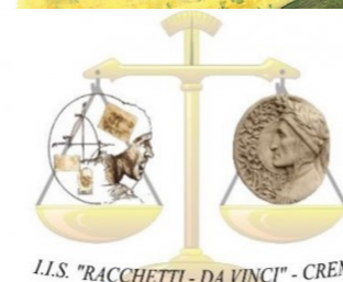
Illustrazione e progetto grafico: Valeria Santilippa